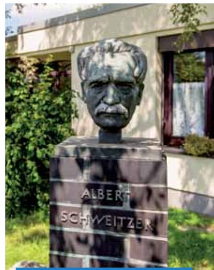
Schweitzers Denkmal erinnert an den Namenspatron

sagen ‚Mein Kind soll die muslimische Religion nahe gebracht bekommen‘, dann schauen wir was möglich ist. Jedes Kind und auch die Kinderdorfeltern sollen ihre Religion und Wertvorstellungen in das Familienleben einbringen können. Der respektvolle und wertschätzende Umgang im Miteinander ist dabei ausschlaggebend und verbindet alle miteinander“. Mit dieser toleranten Grundhaltung finden sich die Kinderdorfeltern und Erzieher in Albert Schweitzer wieder. Einmal im Jahr lernen neue Mitarbeiter beim sogenannten „Einführungstag“ unseren Namenspatron kennen: Sie erfahren, was Albert Schweitzer in seinem Leben bewirkt und welche ethi-