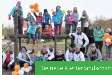
Die neue Kletterlandschaft findet Anklang