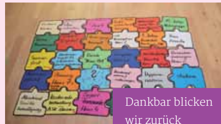
Dankbar blicken wir zurück