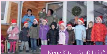
Neue Kita „Groß Luja“