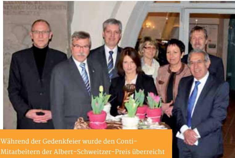
Während der Gedenkfeier wurde den Conti-Mitarbeitern der Albert-Schweitzer-Preis überreicht